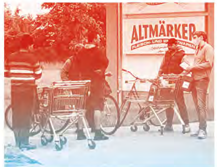
Eine Berichterstattung unter Pandemiebedingungen

Auch über Arbeitszeiten liegen unterschiedliche Informationen vor. Da ist die Rede von acht Studentagen, von zehn Studentagen bei einer 6-Tagewoche, »zwölf bis vierzehn Stunden im Akkord« und – basierend auf einem der wenigen Interviews mit einer rumänischen Saisonarbeiterin